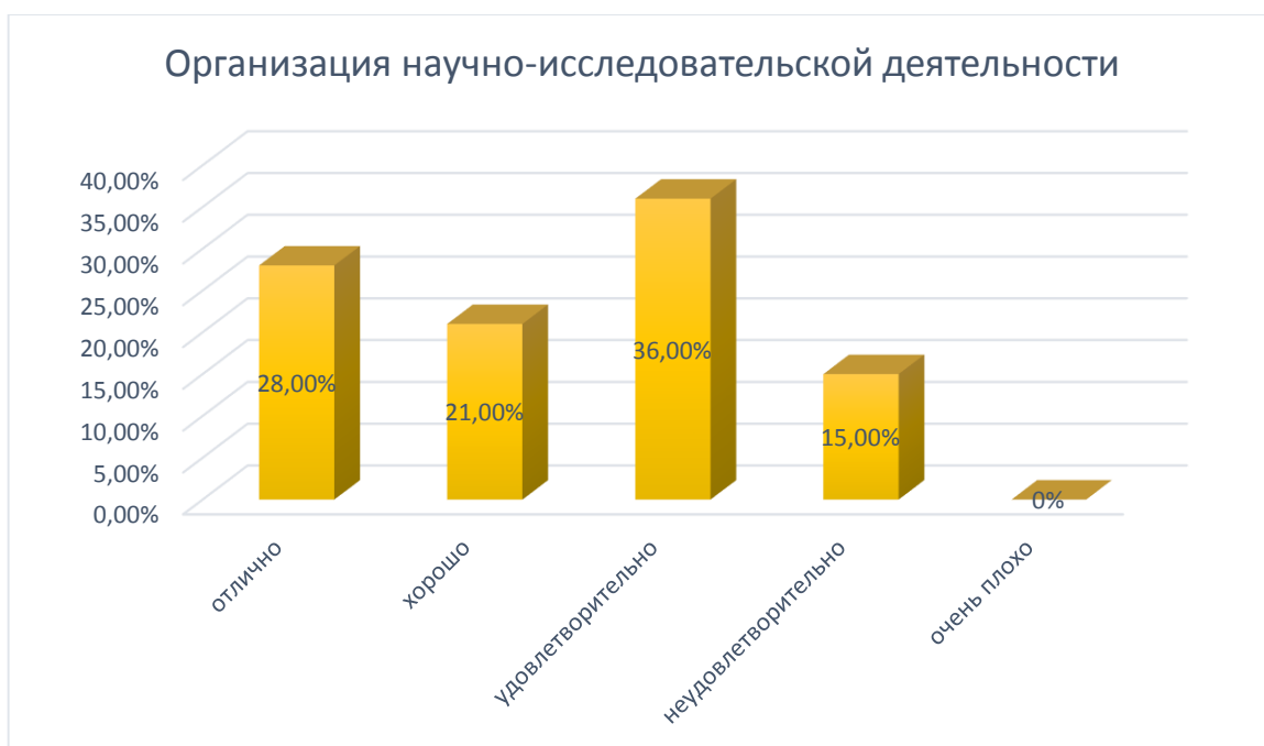
Рис. № 5

Наибольшая часть (85%) выпускников, прошедших анкетирование, оценили организацию научно-исследовательской деятельности положительно. Это весомый аспект, потому как семинары и конференции являются неотъемлемой частью образовательного процесса.