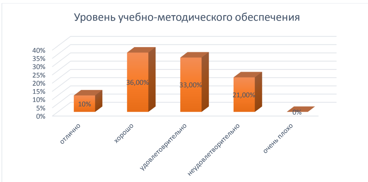
Рис. № 3

79% респондентов удовлетворены актуальностью, новизной, полнотой учебно-методического обеспечения. 21 % опрошенных поставили неудовлетворительную оценку. В таком случае, следует рассмотреть качество учебно-методической базы техникума и ликвидировать недостатки.