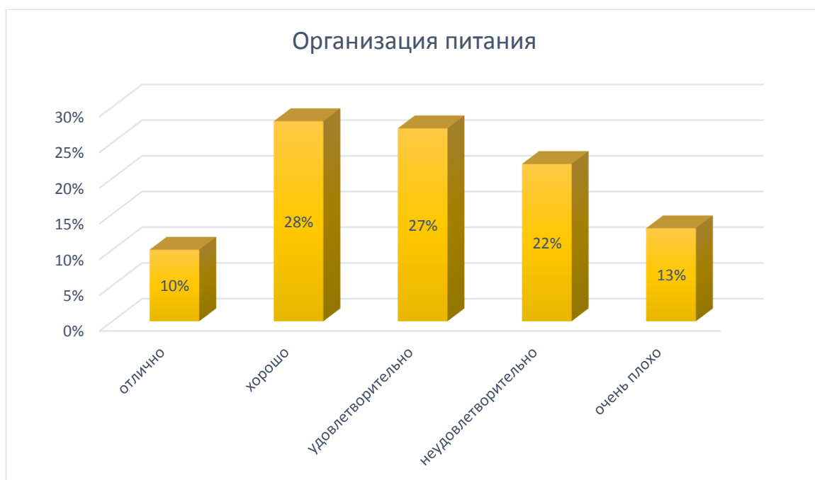
Рис. № 11

Работа пункта питания техникума очень важный и значимый критерий в процессе образовательной деятельности. Треть опрошенных респондентов (35%) оценили качество обслуживания столовой техникума по минимальной шкале «неудовлетворительно» (22%) и «очень плохо» (13%). Несмотря на это, 65% обучающихся довольны организацией питания в техникуме. Таким образом, необходимо пересмотреть ежедневное меню, его разнообразие, качество и своевременность подачи горячего питания для выявления недостатков и их устранения.