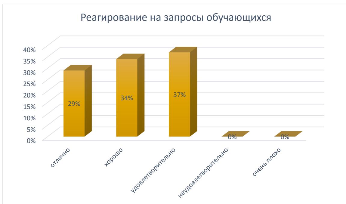
Рис. № 7

Максимальные показатели были выявлены при анализе реагирования на запросы обучающихся. 100% респондентов положительно оценили оперативность и результативность работы административного персонала и педагогических работников.