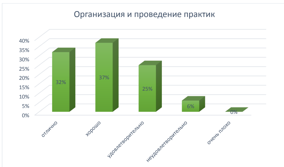
Рис. № 13

состояния комнат для проживания, кухни, душевых комнат. Обратить внимание на температурный режим и освещение.