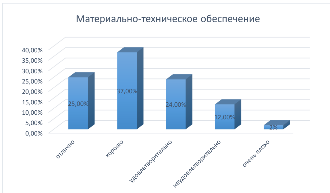
Рис. № 4

79% респондентов удовлетворены актуальностью, новизной, полнотой учебно-методического обеспечения. 21 % опрошенных поставили неудовлетворительную оценку. В таком случае, следует рассмотреть качество учебно-методической базы техникума и ликвидировать недостатки.