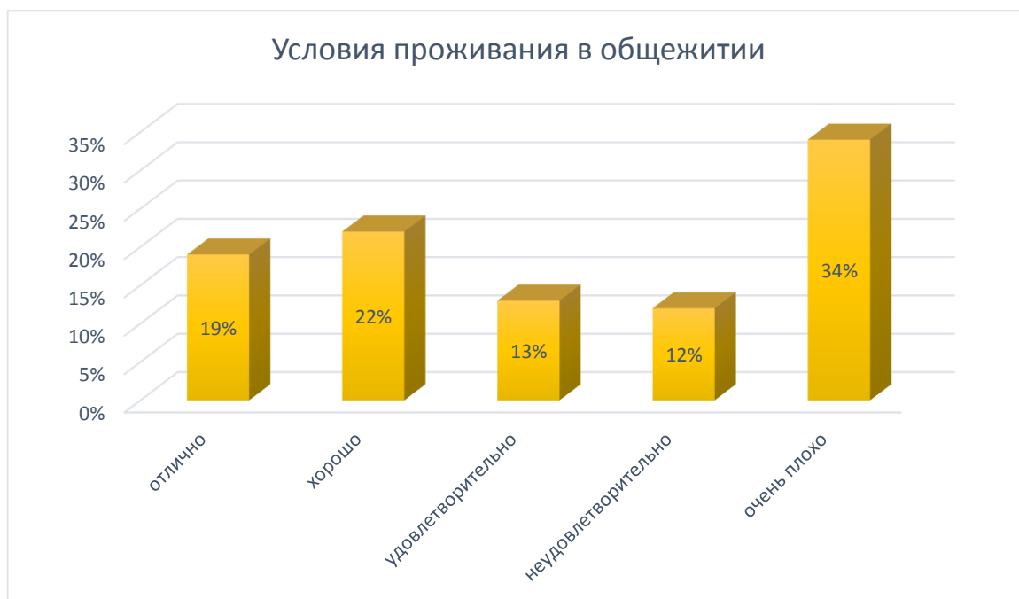
Рис. № 12

Работа пункта питания техникума очень важный и значимый критерий в процессе образовательной деятельности. Треть опрошенных респондентов (35%) оценили качество обслуживания столовой техникума по минимальной шкале «неудовлетворительно» (22%) и «очень плохо» (13%). Несмотря на это, 65% обучающихся довольны организацией питания в техникуме. Таким образом, необходимо пересмотреть ежедневное меню, его разнообразие, качество и своевременность подачи горячего питания для выявления недостатков и их устранения.