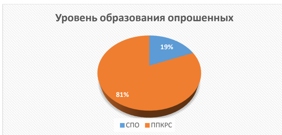
Рис. № 1

Вопросы об удовлетворенности обучающихся выпускных групп качеством условий образовательной деятельности сформулированы с учетом установленных показателей, характеризующих общие критерии качества условий осуществления образовательной деятельности.