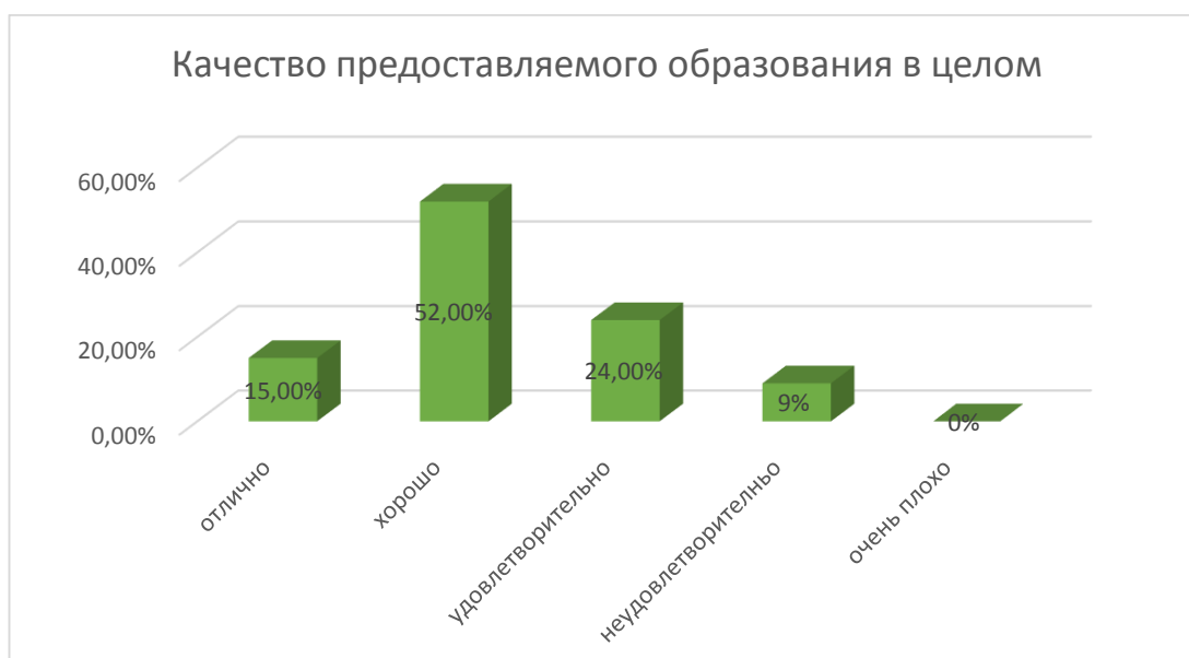
Рис. № 2

Вопросы об удовлетворенности обучающихся выпускных групп качеством условий образовательной деятельности сформулированы с учетом установленных показателей, характеризующих общие критерии качества условий осуществления образовательной деятельности.