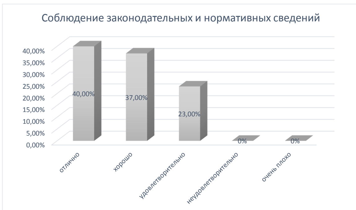
Рис. № 6

Наибольшая часть (85%) выпускников, прошедших анкетирование, оценили организацию научно-исследовательской деятельности положительно. Это весомый аспект, потому как семинары и конференции являются неотъемлемой частью образовательного процесса.