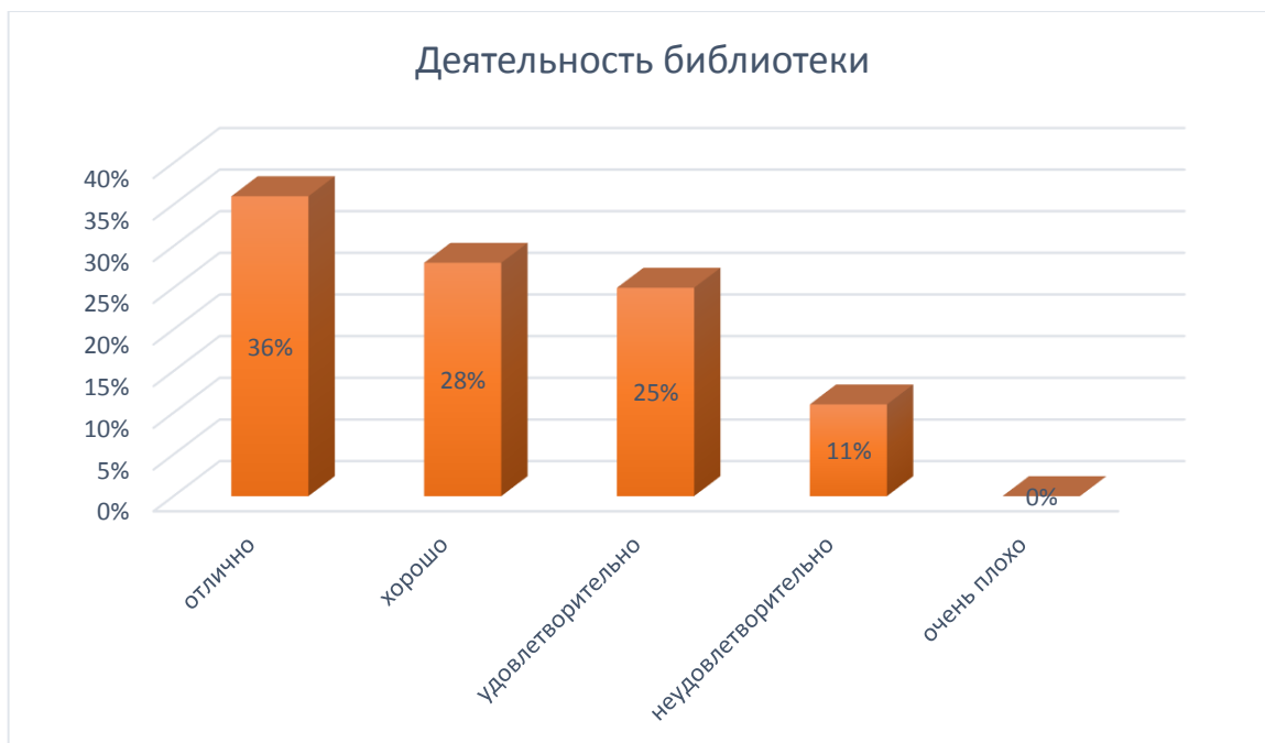
Рис. № 9

Работу библиотечного фонда, его доступность, комфортность и оснащённость неудовлетворительно оценили 11% опрошенных выпускников. Тем не менее, наибольшая часть (89%) поставили положительные оценки деятельности библиотеки. Таким образом, необходимо выявить недостатки в работе библиотеки и улучшить качество пользования. Определить, какие книги и источники наиболее востребованы, и своевременно их пополнять.