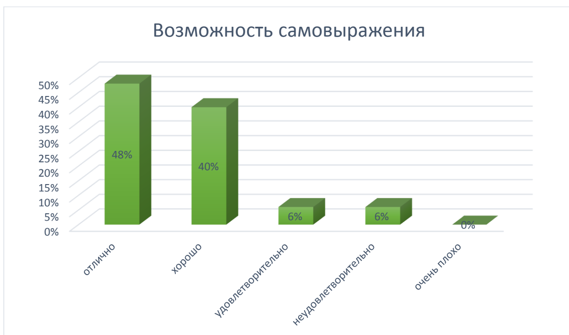
Рис. № 10

Работу библиотечного фонда, его доступность, комфортность и оснащённость неудовлетворительно оценили 11% опрошенных выпускников. Тем не менее, наибольшая часть (89%) поставили положительные оценки деятельности библиотеки. Таким образом, необходимо выявить недостатки в работе библиотеки и улучшить качество пользования. Определить, какие книги и источники наиболее востребованы, и своевременно их пополнять.