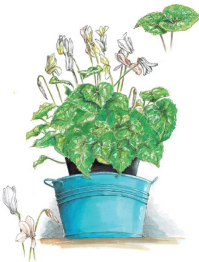
Пример выполнения работы – Рисунок комнатного растения (карандаш, маркер)