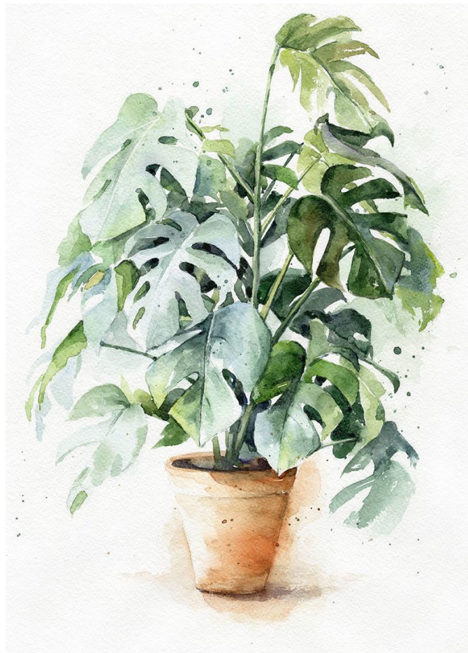
Пример выполнения работы – Рисунок комнатного растения (карандаш, акварель)