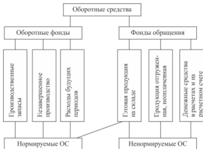
Рис. 6.1. Состав оборотных средств

Оборотные средства (ОС) (оборотный капитал) – это часть капитала организации, вложенная в его текущие активы (рис. 6.1).