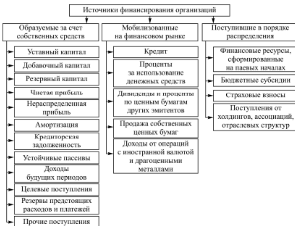
Рис. 7.3. Группировка финансовых ресурсов по источникам их формирования

В зависимости от источников финансирования выделяются группы финансовых ресурсов предприятия (рис. 7.3)