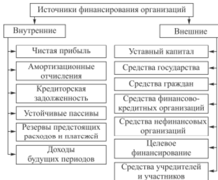
Рис. 7.2. Источники финансирования организаций

В зависимости от источников финансирования выделяются группы финансовых ресурсов предприятия (рис. 7.3)