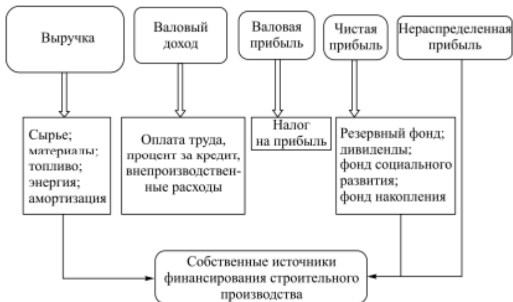
Рис. 7.4. Финансирование строительства за счет собственных средств предприятия

При финансировании строительных организаций за счет собственных средств (рис. 7.4) источниками выступают выручка и амортизация.