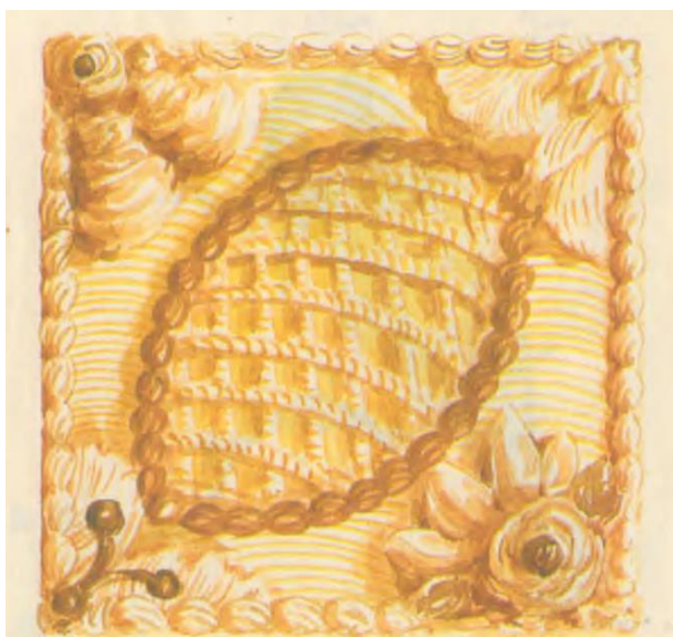
Рисунок пирога можно выполнить в одной горизонтальной проекции (вид сверху), так как в ней видна вся декоративная композиция изделия, вид сбоку, в отличие от кондитерских изделий в пироге, не несёт какой – то особенной смысловой нагрузки (см.пример рис.1)