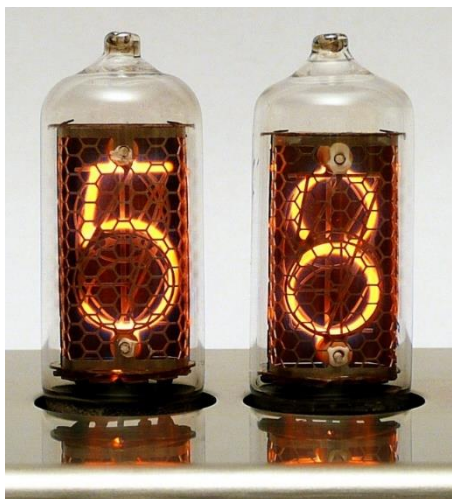
индикаторы ИИ-8, ИИ-8-2, ИИ-14, ИИ-16, ИИ-17, ИИ-18

Однако газоразрядные матричные индикаторы продолжают устанавливаться в новые автоматы и в наши дни. Почти все они — постоянного тока, без самосканирования и запоминания информации. Применяются в этих автоматах и сегментные газоразрядные индикаторы, подобные «панаклексам», но значительно реже.