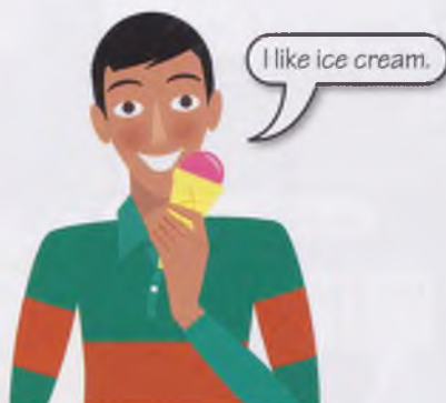
He's eating an ice cream. He likes ice cream.

They read / he likes / I work etc. = the present simple :