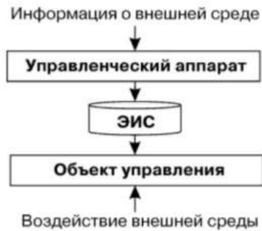
Схема 4 Автоматизированная форма бухгалтерского учета