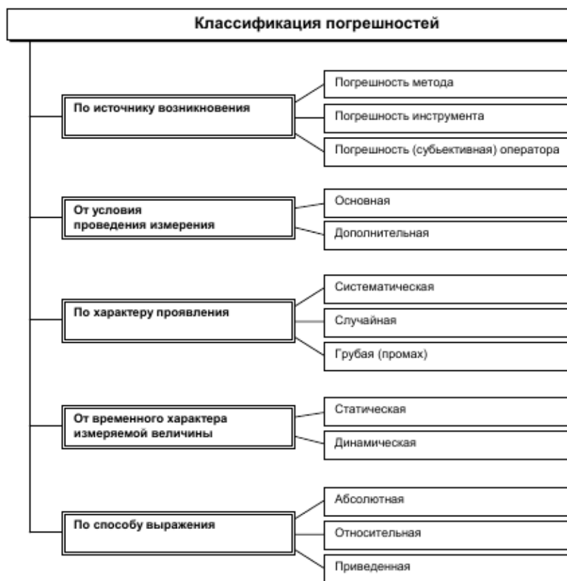
Рисунок 1.1 – Классификация погрешностей

Погрешность метода обуславливается несовершенством метода и приемов использования средств измерений. Например, при определении мощности постоянного тока по показаниям амперметра и вольтметра без учета мощности, потребляемой указанными приборами, возникает методическая погрешность .